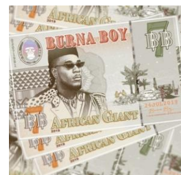
Burna Boy cd